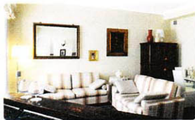
VIA DELLA MOSCOVA, stile classico e comfort moderni, pagina 10