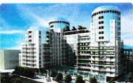
VIA PIRELLI, residenze "light-tech" nel cuore di Milano, pagina 13