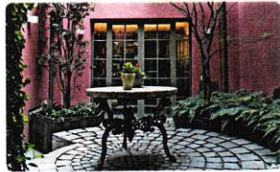
VIA CARLO D'ADDA, luxury living sui Navigli, pagina 8